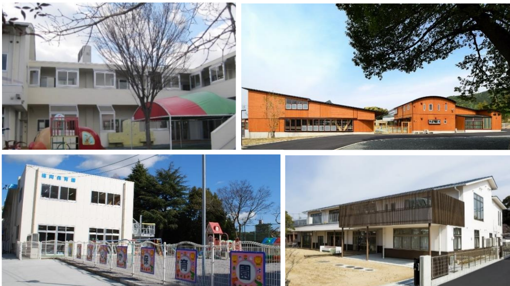
施設整備後の様子