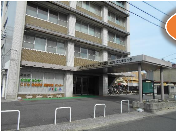
ココエールの外観

ココエール(こども若者総合相談支援センター)が 開館日の拡大などにより、ますます身近に利用しやすくなります